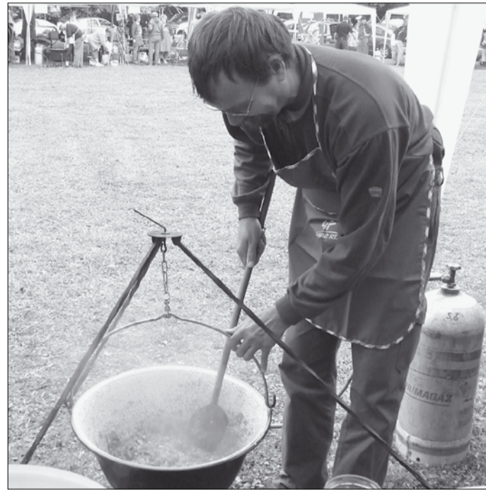
Készül a remekmű