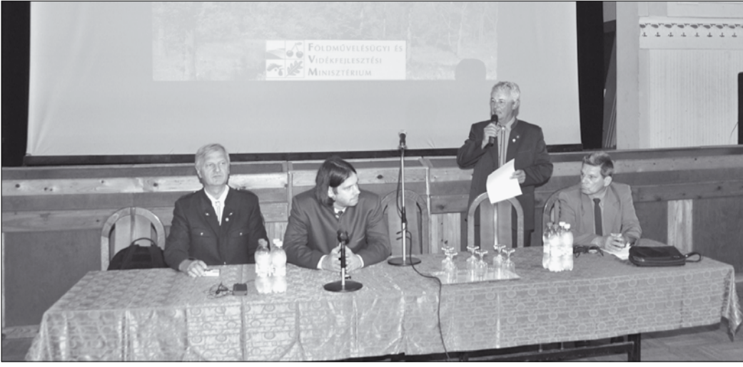
(Folytatás az 1. oldalról)

Az előadó a továbbiakban a támogatási rendszerről és a 2010. évi költségvetés sorainak tervezetéről adott tájékoztatást.