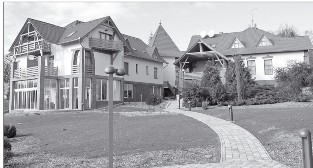
A kardosfai udvaron lévő lámpák is teljesítik az elvárásokat

Mint korábban beszámoltunk róla: a Zselici Tájvédelmi Körzet területén – Európában elsőként – csillagászbolt-parkot alakít ki a Duna-Dráva Nemzeti Park Igazgatóság és a Magyar Csillagászati Egyesület, mely programhoz többek között cégünk, illetve a Hotel Kardosfa is csatlakozott. Olyan helyi szabályozások bevezetésére került, illetve kerül