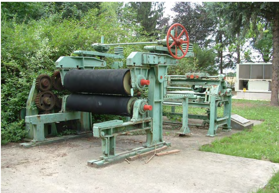
Ábra. Síkszita Mohácson

Síkszita, a Mofa-Kronospan udvarán, amely a ma is működő farostlemezgyár elődjének számító szegedi Farostlemez Kísérleti Üzemben működött.