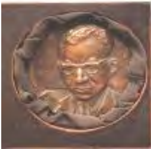
Ábra. A Tarisznyás Márton emléklakett

Forrás: Fatáj-online, 2011-02-17, Magyar Asztalos 2011/10: 83-