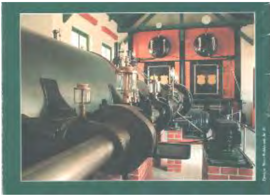
Ábra. Ipari műemlék gőzgép és kazán Lentiben