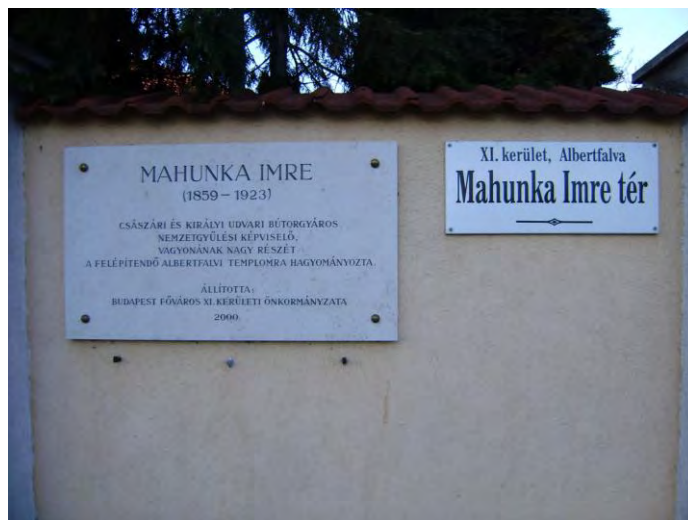
Ábra. Mahunka Imre tér

A Lágymányosi – ma már – Rákóczi híd pesti hídfőjénél a Művészetek Palotája és a Nemzeti Színház melletti egyik utca Thék Endrének és kortársának, a norvég építési vállalkozónak Gregersen Guilbrandnak a nevét viseli