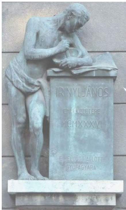
Ábra. Irinyi János gyárának emléktáblája Budapest – Józsefvárosban