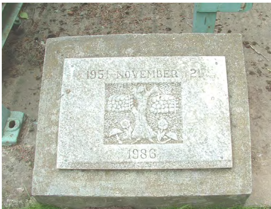
Ábra. Az első hazai farostlemez emléktáblája Mohácson

Mohácson, a mai Kronospan-Mofa farostlemezgyár udvarán 1986-ban elhelyezett tábla őrzi az első hazai előállítású farostlemez (1951) emlékét.