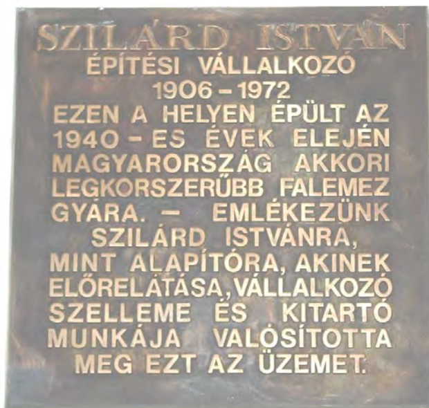
Ábra. Szilárd István emléktábla

A Hárosi Falemezművek alapításának (1940-es évek) és alapítójának Szilárd István (1906 – 1972) építési vállalkozónak állítottak emléket az irodaépület falán (Budapest XXII. Háros) elhelyezett emléktábla.