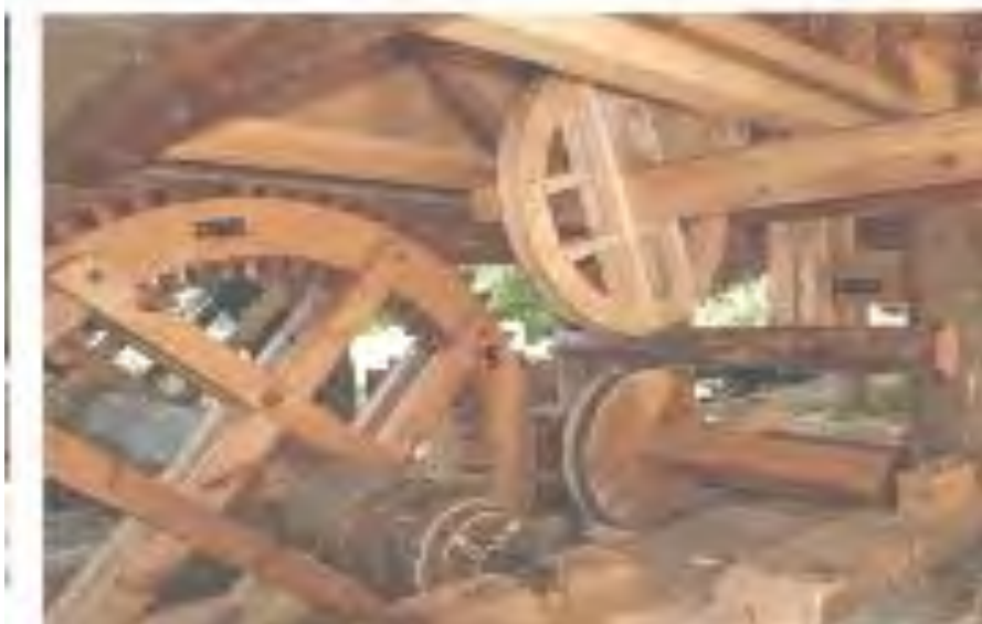
Ábra. A hajtómű a fűrészmalomban